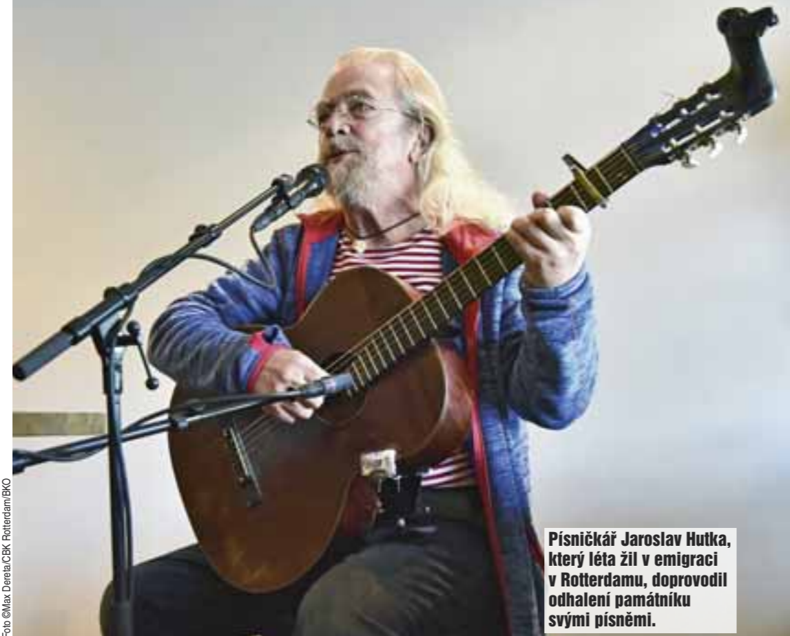
Písničkář Jaroslav Hutka, který léta žil v emigraci v Rotterdamu, doprovodil odhalení památníku svými písněmi.