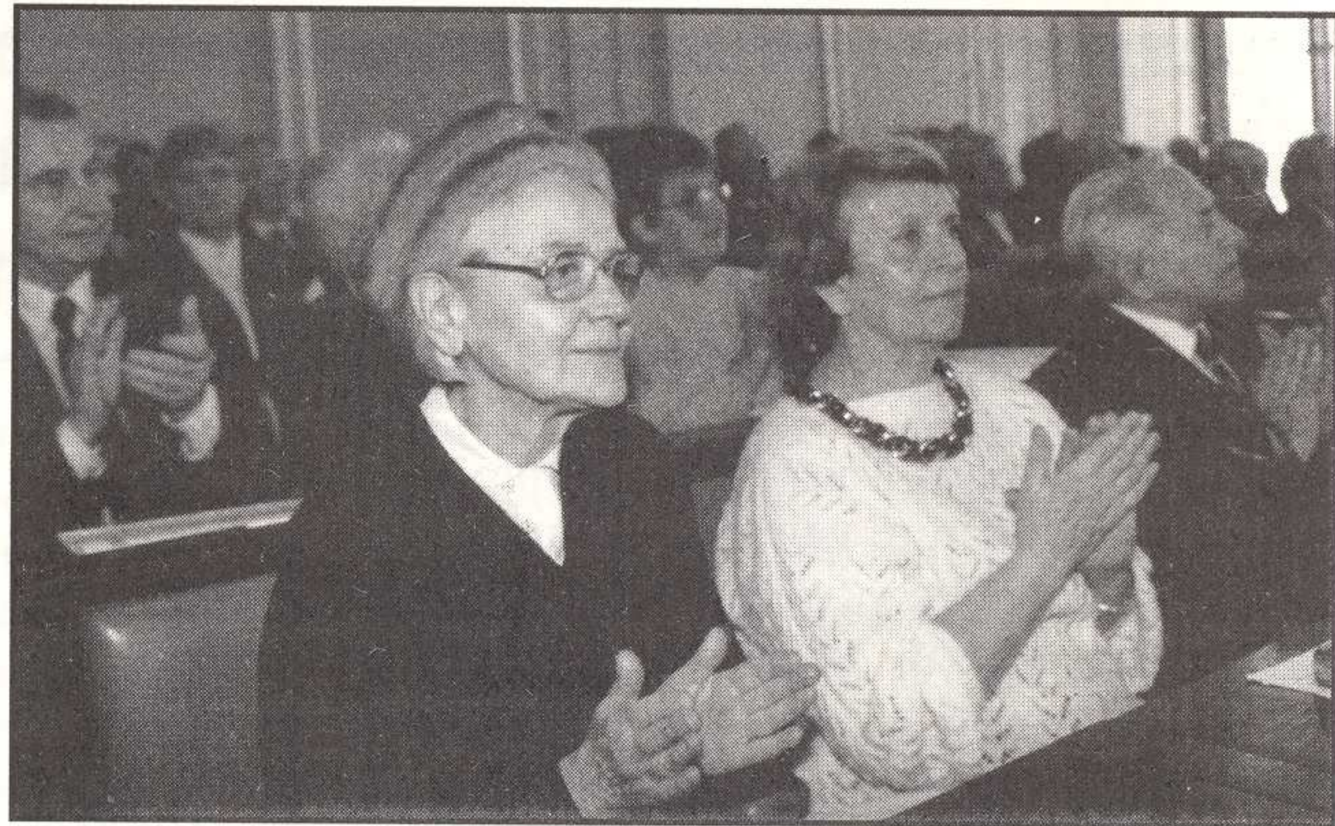
Pohled do pléna